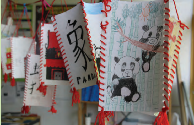
Pandaproducten van de Ericaschool

Dit was ons verhaal. Wij vonden het heel leuk. Ben jij nu nieuwsgierig geworden ga dan naar Ouwehands Dierenpark in Rhenen daar zijn de panda's te zien, maar ze zitten nu nog in quarantaine.